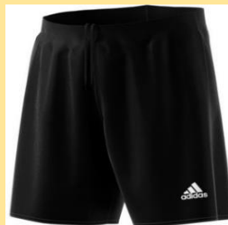
Parma ohne Innenslip - 13€ AJ5880