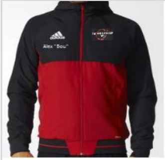
Präsentations Jacke - 40€ BQ2771