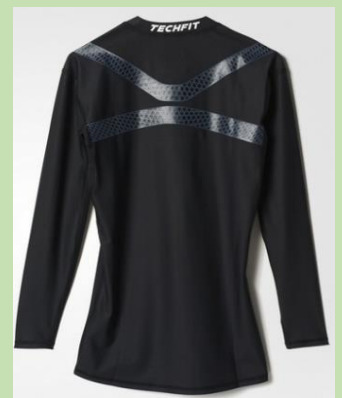
Techfit Power Schirt - 52€ AJ5712