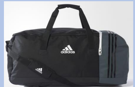
Team Bag ohne Bodenfach M - 27€ (B46123) L - 30€ (B46122)