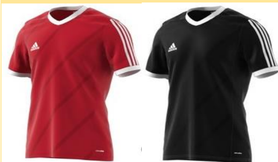
Tabela 14 - 16€ F50274