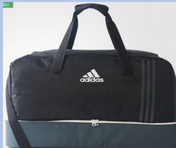
Team Bag mit Bodenfach M - 30€ (B46123) L - 33€ (B46122)