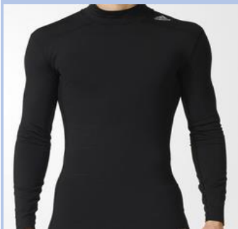
Techfit Climawarm - 30€ AI3357