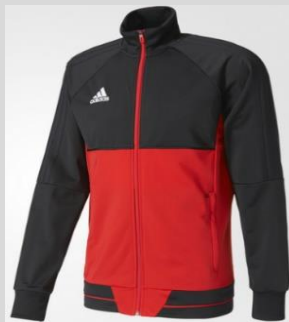
Trainings Jacke - 26€ BQ2596