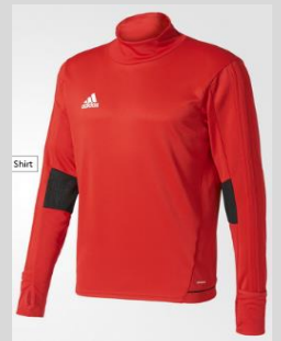
Trainings Top - 33€ BQ2732