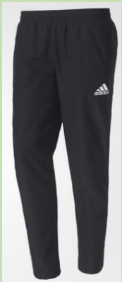
Woven Pant - 28€ AY2861