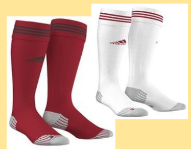
Asisock 12 - 8€ Rot X20998 - Weiß X20995